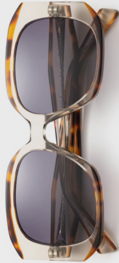
COMING IN APRIL