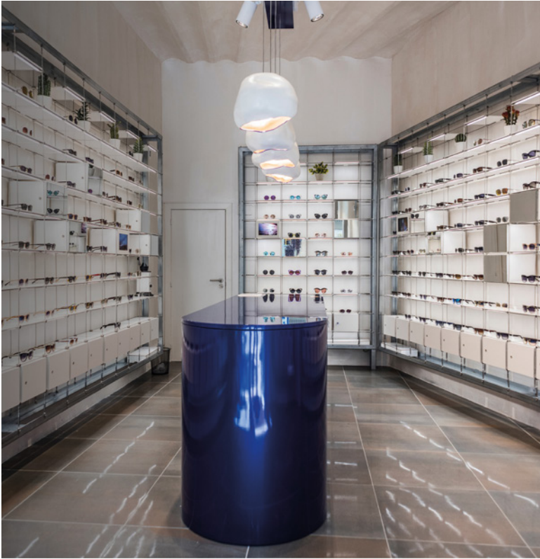
LABORATORY STORE IN THE CENTER OF BARCELONA, 2016