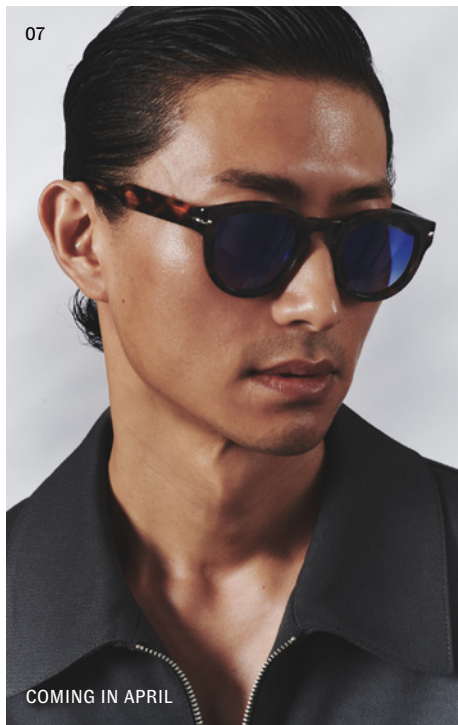
COMING IN APRIL